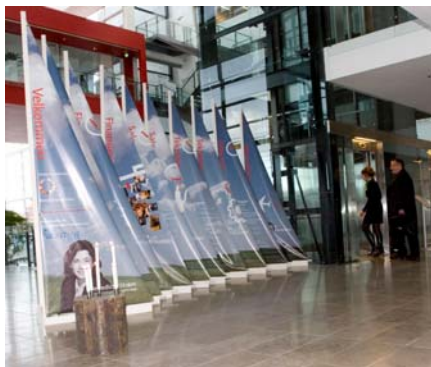
Velkomstsejl ved hovedindgangen på Alsion

Tirsdag den 18. november, holdte Væksthuset i samarbejde med CfE et arrangement på Alsion med fokus på "HR og ledelse".