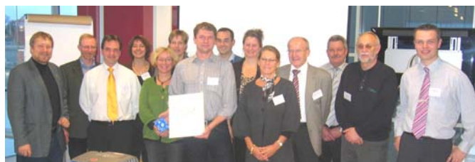
Firmakontoret.dk modtog første "Rådgiverpris"

er i stand til her og nu at vejlede iværksætteren med det konkrete problem man står overfor. Rådgivernetværket består af cirka 40 lokale virksomheder, hvoraf cirka halvdelen var med til prisoverrækkelsen den 17. november.